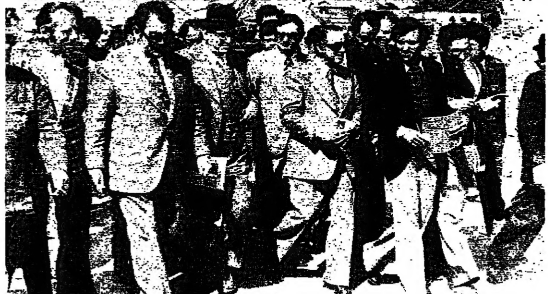
وزير الموارد ومراقبه في المرفأ